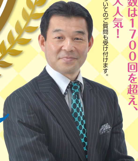
講師 家庭教育プロデューサー

◆家庭教育についてのご質問も受け付けます。 講演回数は1700回を超え、 全国で大人気!